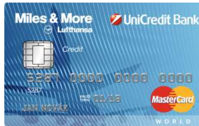
kreditní platební karta „Miles & More“