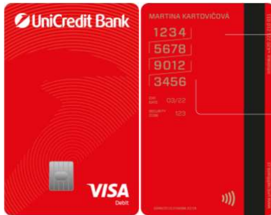
debetní platební karta „standard“