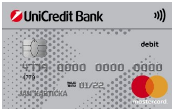
embosovaná debetní platební karta „standard“