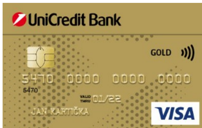
embosovaná debetní platební karta „zlatá“