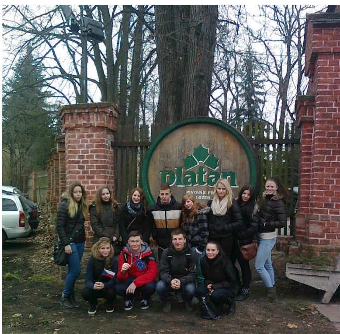
HC2 na exkurzi v Protivíně