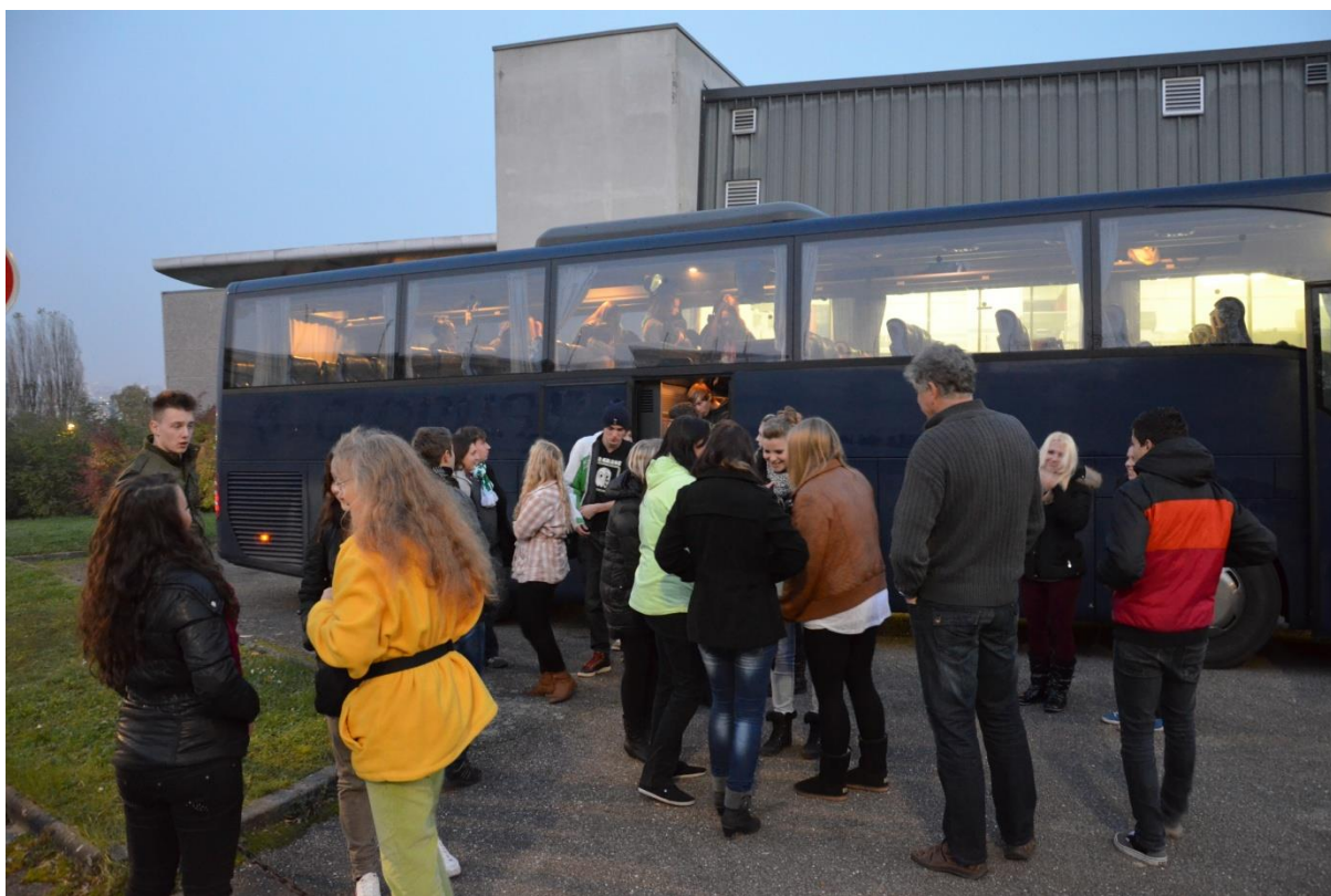
Podzimní odjezd z Nancy