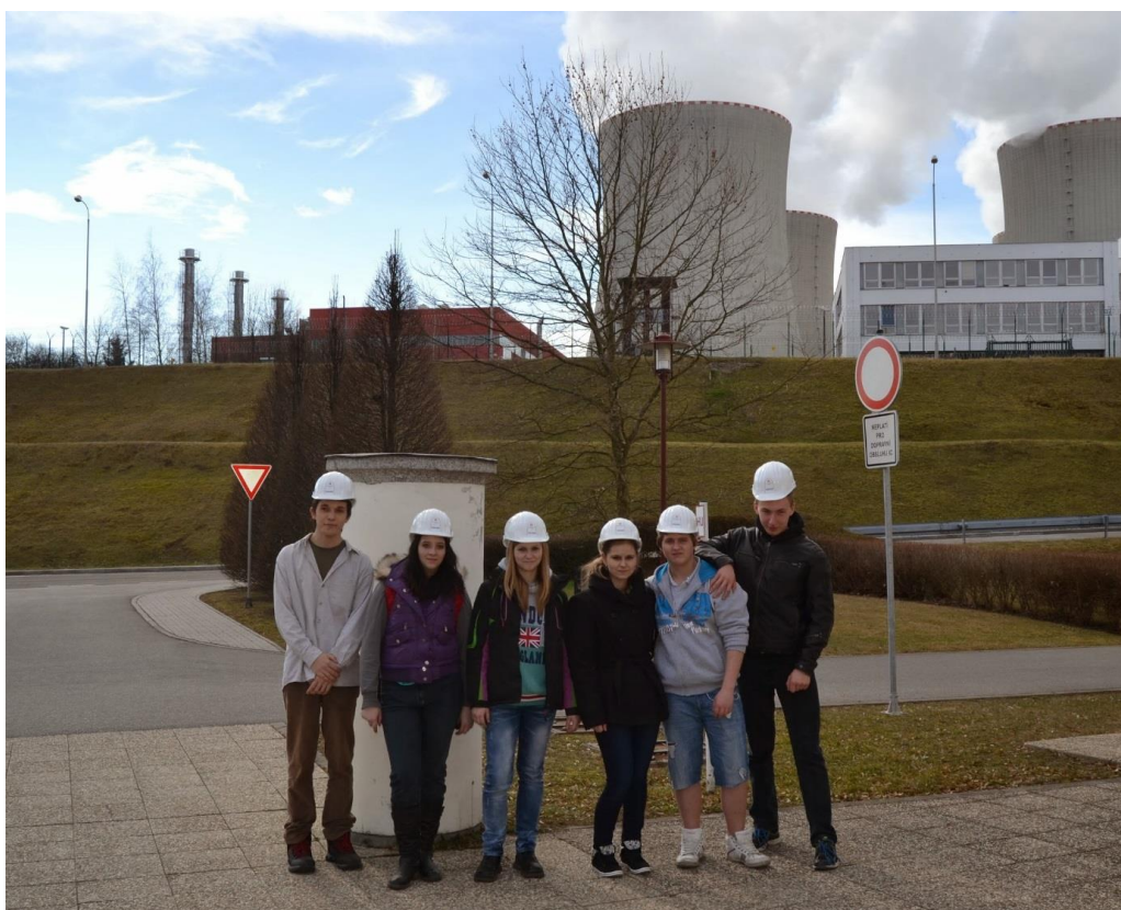
Před JE Temelín