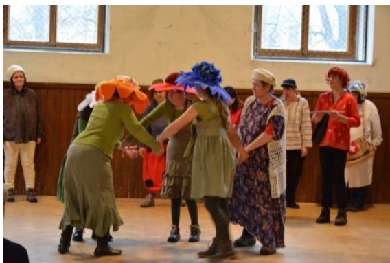
Ukázka z divadelního představení...

Po vystoupení, které se konalo v tělocvičně školy, se klienti s několika žáky vydali na slavnostní oběd do restaurace Na Plzeňské. Spokojené pohledy dokazovaly, že všem chutnalo. Nicméně výraz všech se brzy změnil, neboť jsme začali sestupovat do pekla v dole Marie na Březových Horách. Trocha strachu a chvilkového zděšení nás donutila zamyslet se, zda se opravdu vždy chováme dobře a správně. Od Mikuláše jsme dostali nějaké dobroty a zamířili jsme do cukrárny.