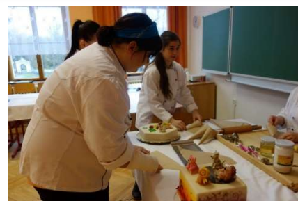
Prezentace práce žáků školy na Informačních dnech

Informační dny proběhly dále ve dnech 2. 12. v době 13:00 – 16:00 a 6. 1. 2016 v době 13:00 – 16:00.