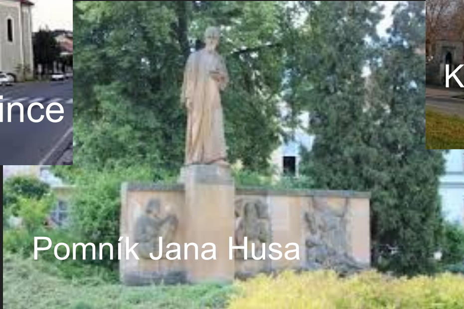
Pomník Jana Husa