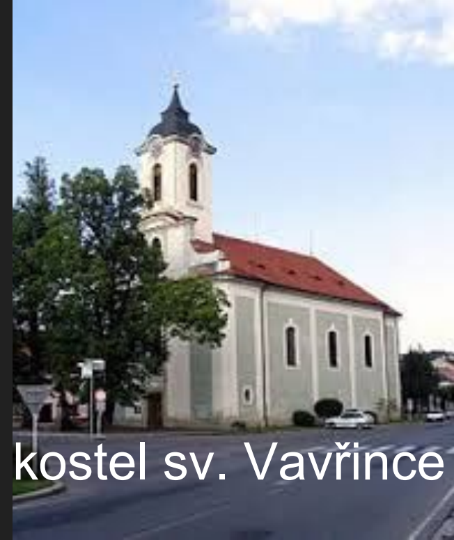
kostel sv. Vavřince