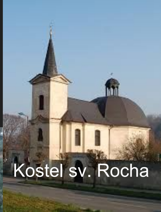
Kostel sv. Rocha